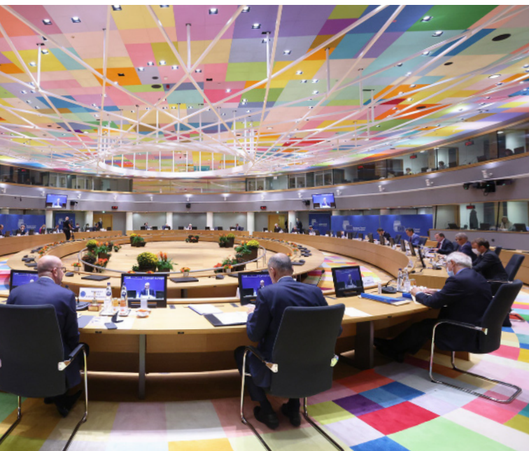
Rada Europejska, 21 października 2021 r.

wymagają omówienia w gronie przywódców UE. W przeszłości takie pilne kwestie dotyczyły na przykład pandemii Covid-19, kryzysu bankowego, kryzysu migracyjnego czy walki z terroryzmem. Tematy bywają tak skomplikowane lub politycznie drażliwe, że przywódcy zazwyczaj omawiają je kilkakrotnie i do rozwiązania dochodzą stopniowo.