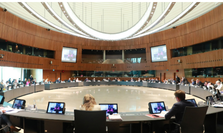
Rada ds. Zatrudnienia i Spraw Społecznych, Luksemburg, 14 czerwca 2021 r.

Rada UE spotyka się na ogół w Brukseli, z wyjątkiem kwietnia, czerwca i października, kiedy to posiedzenia odbywają się w Luksemburgu. Posiedzenia są organizowane według dziedzin polityki. Są zatem posiedzenia poświęcone finansom, środowisku, energetyce, wymiarowi sprawiedliwości itd. i w każdym uczestniczą ministrowie odpowiedniego resortu. Rada UE spotyka się w 10 formatach specjalistycznych, zwanych składami. Co roku odbywa się 70–80 posiedzeń i każdemu przewodniczy minister, który odpowiada za omawianą dziedzinę w państwie członkowskim sprawującym prezydencję w Radzie UE. W posiedzeniach Rady UE uczestniczą też komisarze europejscy odpowiedzialni za daną dziedzinę, nie mają jednak prawa głosu.